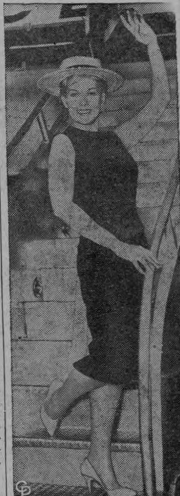
REGRESA DE EUROPA.—La actriz Kim Novak saluda a su llegada a Nueva York procedente de Europa. Dijo que quería casarse pero antes estar "completamente enamorada". Manifestó no tener interés romántico con Cary Grant

PARIS 15 (UPI).—Los sindicatos franceses cancelaron hoy la huelga general que tenían dispuesta para mañana en toda la enorme red ferroviaria de la nación, con lo que se dispuso el peligro de un serio conflicto entre los trabajadores y el gobierno del General Charles De Gaulle. Los sindicatos decidieron cancelar la huelga después de una conferencia de última hora con el Ministro de Obras Públicas, Robert Buron. Actuando en nombre del gobierno, propietario de la red ferroviaria, Buron propuso reiniciar las negociaciones con los sindicatos sobre los aumentos de salarios exigidos por éstos. A objeto de asegurar la continuidad del servicio, el gabinete decretó el sábado pasado la movilización militar de los obreros ferroviarios, pero éstos anunciaron de inmediato que no acatarían dicho decreto, a pesar de que con ello se exponían a severas penas de prisión o multa. Todas las grandes organizaciones sindicales, incluso la confederación general del trabajo, dirigida por los comunistas, aceptaron la tregua y ordenaron la cancelación de la huelga. Más de 360.000 ferroviarios pensaban parar mañana por ocho horas, a partir de las 4 a. m., a pesar de la orden del gobierno de continuar en sus trabajos.