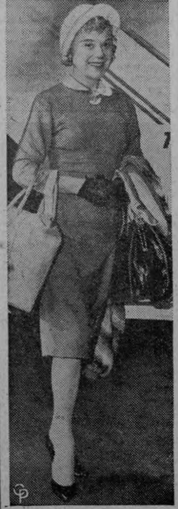
SONIA DE VACACIONES.—Sonia Henie, famosa reina de los patines de hielo de hace pocos años, aparece en el aeropuerto internacional de Nueva York, donde tomó un avión para irse de vacaciones a Europa

TOKIO, 15 (UPI).— El gobierno de Vietnam comunista denunció hoy que un avión de Vietnam Meridional violó el espacio aéreo desmilitarizado entre las regiones divididas de la antigua colonia francesa. La agencia de noticias de Vietnam (Septentrional) dijo que la violación ocurrió el sábado cuando un avión C-47 voló sobre la región próxima a la desembocadura del río Cua Tung. La agencia agregó que se ha presentado una protesta por el caso a la comisión internacional de armisticio militar.