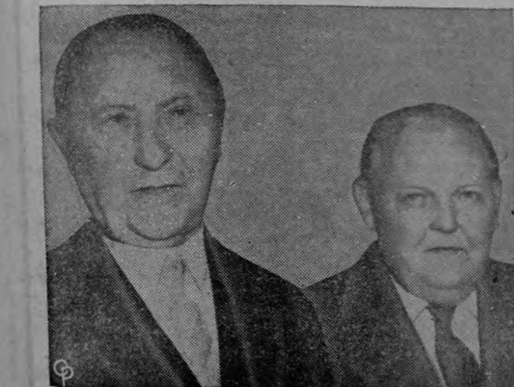
ADENAUER PIDE EXCUSAS A ERHARD.—El Canciller de Alemania Occidental, Konrad Adenauer (izquierda), y el Ministro de Economía Ludwig Erhard aparecen después de una reunión del Partido Demócrata Cristiano en Bonn. En el mitin Adenauer pidió excusas a Erhard por haber dudado de sus puntos de vista respecto a la política. Adenauer seguirá de Canciller y Erhard mantendrá el actual cargo