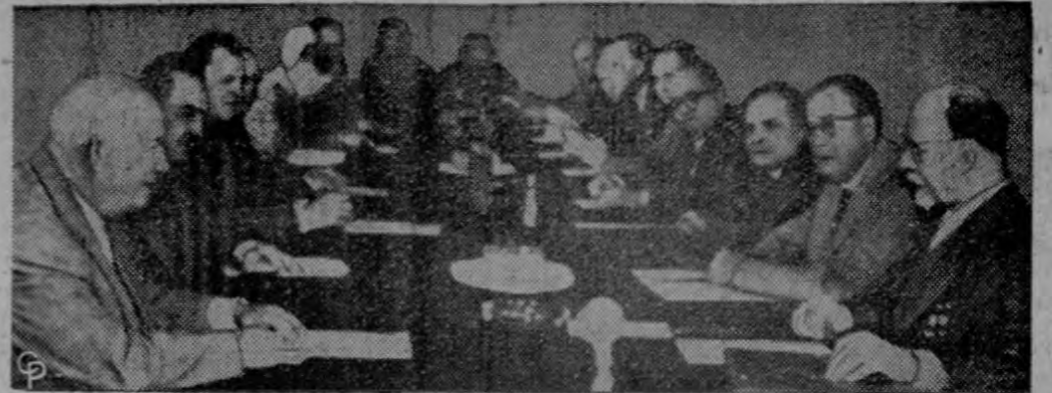
COMUNISTAS ALEMANES EN MOSCU.—El Premier soviético Nikita S. Khrushchev (izquierda, al frente), se reúne con una delegación de líderes de Alemania Oriental dirigida por el jefe del Partido Comunista de Alemania Oriental Walter Ulbricht (derecha, al frente). La reunión quiere dar a entender la unidad en el campo comunista y la determinación de los rojos de obtener un arreglo en Alemania según sus condiciones.