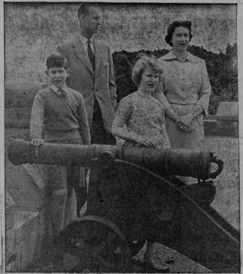
Aquí posa la Reina Isabel II y su esposo el Príncipe Felipe con sus hijos el Príncipe de Gales y la Princesa Ana en la terraza del Este del Castillo de Windsor. La Reina sale, en compañía de su esposo, en un viaje de seis semanas a Canadá el 18 de este mes